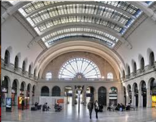
Glastak, rosettfönster Gare de l'Est Paris