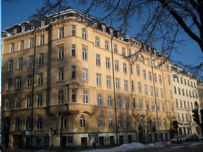
Karlbergsvägen: G. Vasa församling och Kejsarkronan vid Odenplan