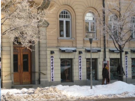
Stensockel Västmannagatan/Odeng. Småspröjsat upptill Kejsarkronan Odenplan