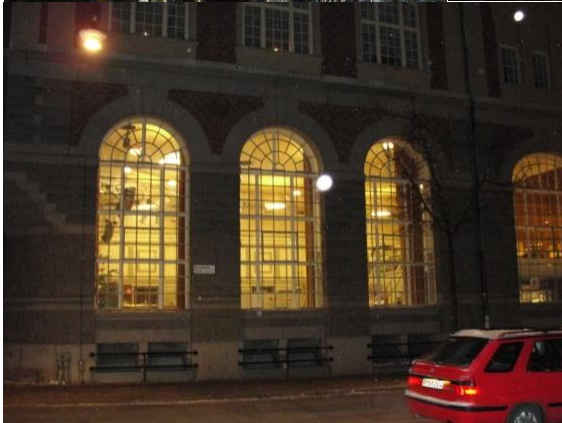
Fönster Bryggeriet Norrtullsgatan