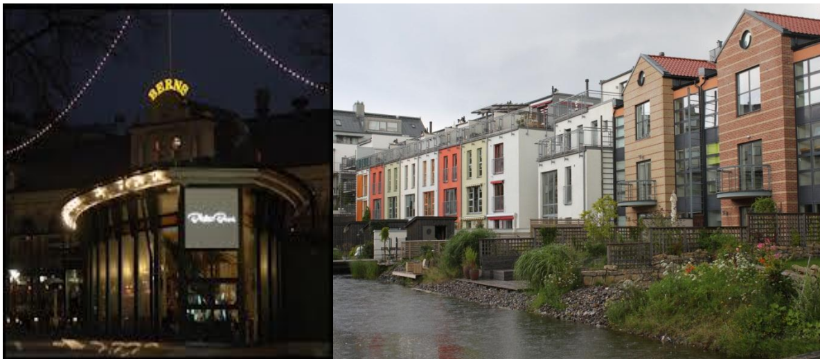
Paviljongen Berzelii park Sthlm